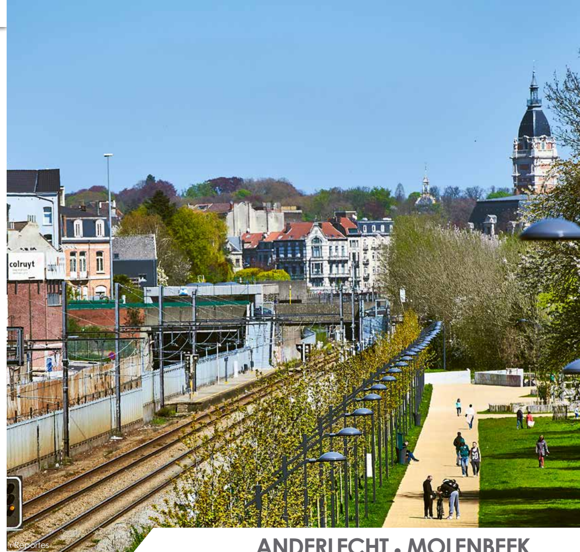
V.U.: Dhr. Bossut, Vooruitgangstraat 56, 1210 Brussel - E.R.: M. Bossut, Rue du progrès 56, 1210 Bruxelles

ANDERLECHT • MOLENBEEK KOEKELBERG • JETTE • BRUSSEL