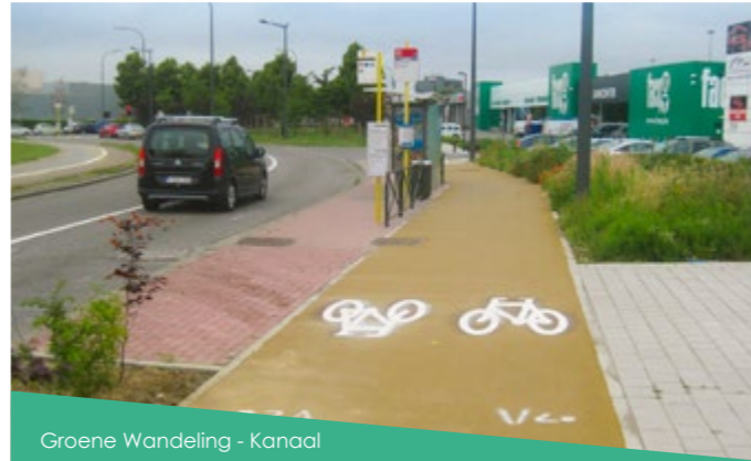
Groene Wandeling - Kanaal

Voor de wandel- en fietsroute Groene Wandeling neemt Beliris de heraanleg van bepaalde paden en de beveiliging van verschillende toegangen op zich. Dit traject van 62 km omringt het Brussels Hoofdstedelijk Gewest en doorkruist parken en beschermde natuurgebieden. Beliris heeft de aanleg en beveiliging gerealiseerd van het stuk tussen Vorst en Anderlecht en het stuk van de oude tramweg Brussel-Tervuren tussen Oudergem (Delta) en Sint-Pieters-Woluwe - en zijn 17 toegangen - op een lengte van 6 km.