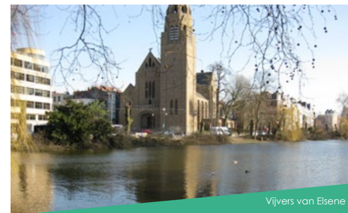
Vijvers van Elsene