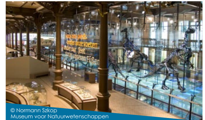
© Normann Szkop Museum voor Natuurwetenschappen