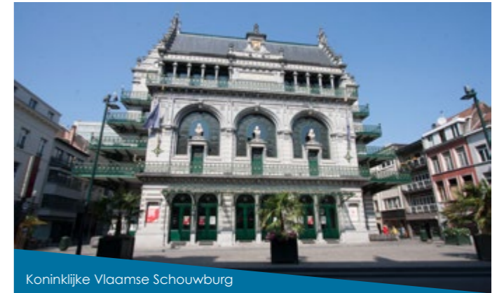
Koninklijke Vlaamse Schouwburg

Dankzij het expositie en conferentiecentrum Square, het vernieuwde Congressenpaleis , kan Brussel zich wereldwijd positioneren als dé congresstad bij uitstek. Het vernieuwde Paleis, meer dan 10.000m 2 groot, kan meer dan 3000 deelnemers ontvangen in een magnifiek kader met fresco's van Magritte, Delvaux en Van Lint.