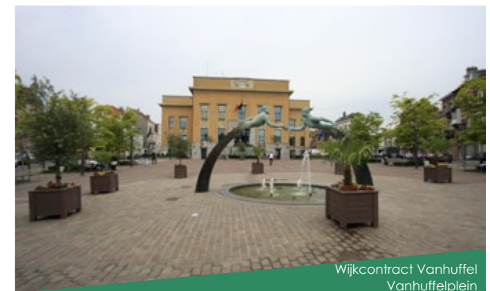
Wijkcontract Vanhuffel Vanhuffelplein

“Het is belangrijk om vanaf de studie tot en met de eindoplevering rekening te houden met wensen, eisen en opmerkingen van de buurtbewoners en de gemeente. We komen immers tussen in hun woonomgeving. Terwijl wij slechts kort in een wijk actief zijn, is het de leefwereld voor de bewoners. We werken misschien met bouwmaterialen, maar vooral met en voor mensen.”