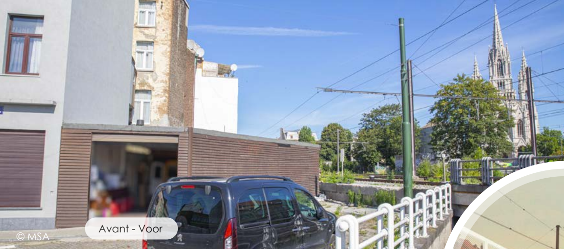
Avant - Voor