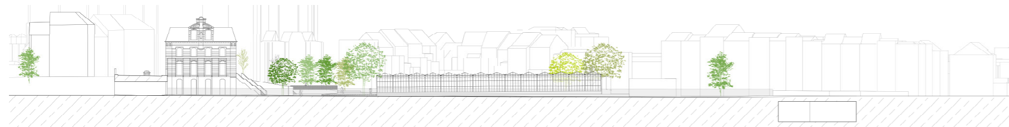
Élévation NORD au 1:1000 / NOORD gevel schaal 1:1000