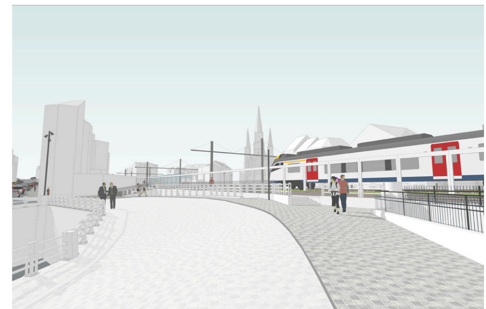
l'avenue de la Reine - départ de la piste / Koninginnelaan - start van de verbinding