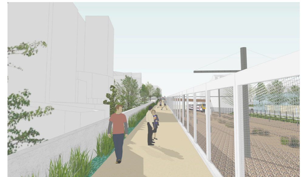
La piste cyclo-piétonne / de wandel- en fietsverbinding