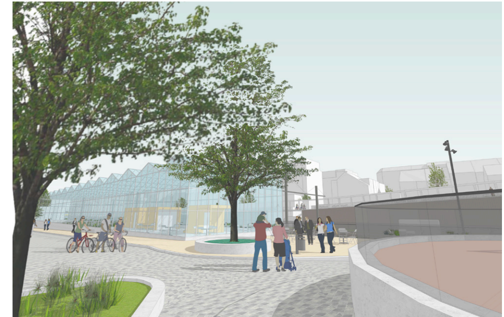
Vue depuis le parc Annie Cordy vers la serre / Zicht vanuit het Annie Cordy park naar de kas