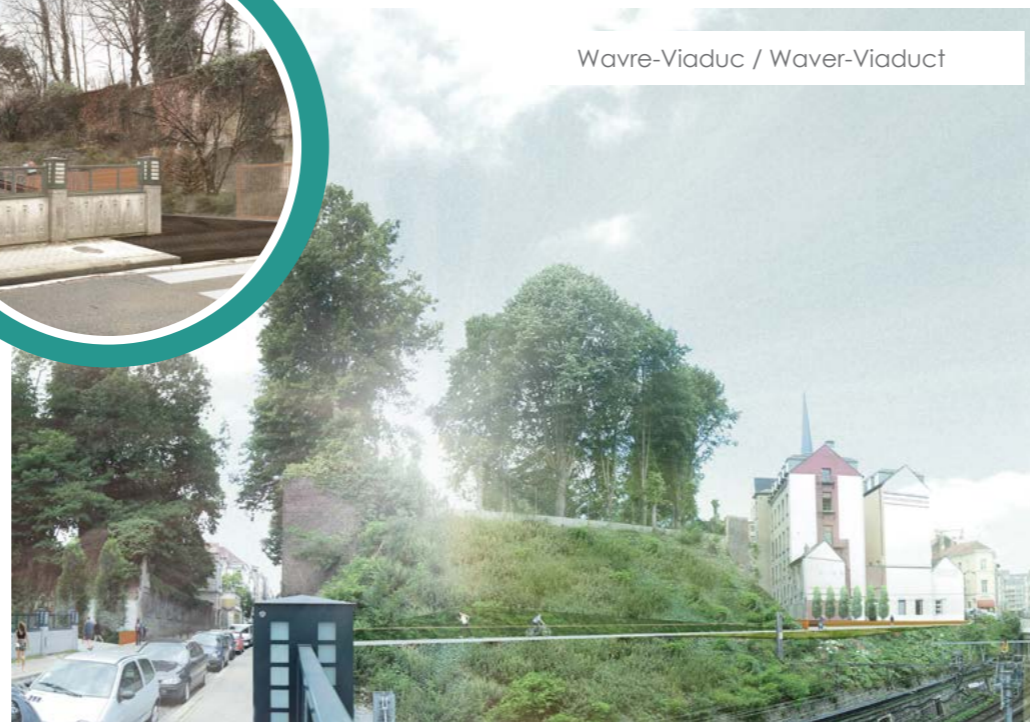
Wavre-Viaduc / Waver-Viaduct

De Europese wijk en diens directe omgeving had nood aan kortere, kwaliteitsvollere routes voor wandelaars en fietsers. Dat bleek uit verschillende studies uitgevoerd in het kader van wijkcontract Scepter en het masterplan voor de Europese wijk. Daarom werd er besloten om een aantal nieuwe verbindingen te creëren tussen de Europese wijk en de wijk Gray/Mouterij weg van het autoverkeer.