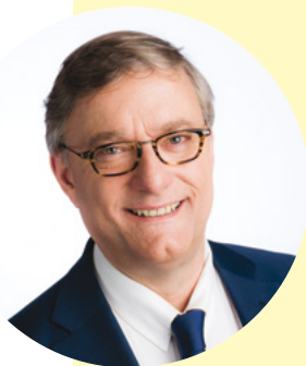
VINCENT DE WOLF BOURGEMESTRE BURGEMEESTER MAYOR

La place Jourdan va connaître un nouveau visage en 2018. Une place plus conviviale, plus verte et plus spacieuse pour l'ensemble des habitantes et habitants verra le jour. Ce sont des dizaines de milliers de personnes qui chaque année convergeront vers le marché, les commerces et les fêtes populaires sur une place encore plus accueillante! Ce sera aussi l'occasion de déguster les célèbres frites de la toute nouvelle Maison Antoine!